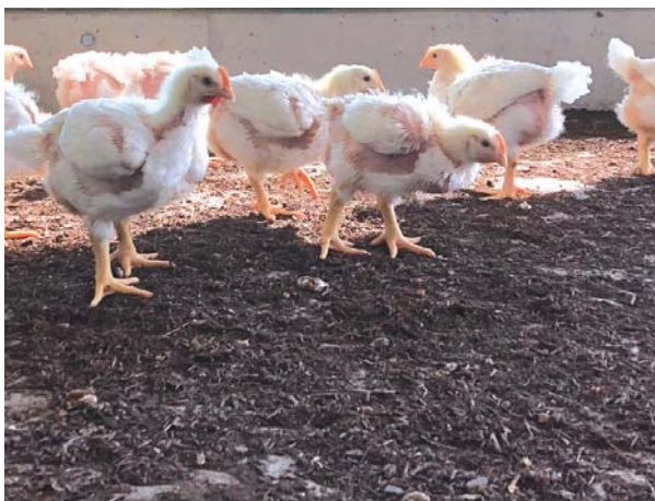
Die Naturbett® Geflügeleinstreu im Pouletstall. Auffallend ist die dunkle Farbe und die heterogene Struktur mit größeren Holzstücken sowie einem relativ grossen Feinanteil.

Die positiven Ergebnisse bei der Einstreuqualität lassen darauf schliessen, dass Naturbett® Geflügeleinstreu die eingetragene Feuchtigkeit schneller wieder an die Luft abgibt. Dies könnte mit dem hohen Feinanteil und der dadurch grossen Gesamt-Oberfläche erklärbar sein. Ein Material mit hoher Saugfähigkeit ist nicht unbedingt vorteilhafter, sofern es das Wasser weniger gut an die Luft abgeben kann. Die Tatsache, dass die Naturbett® Geflügeleinstreu in diesem Versuch die schlechteste Saugfähigkeit im Labor, aber die beste Ein-